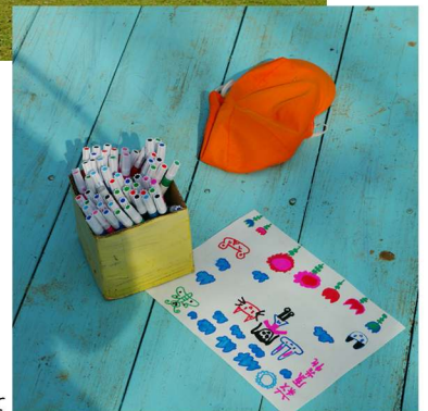
写真：国上保育園にて