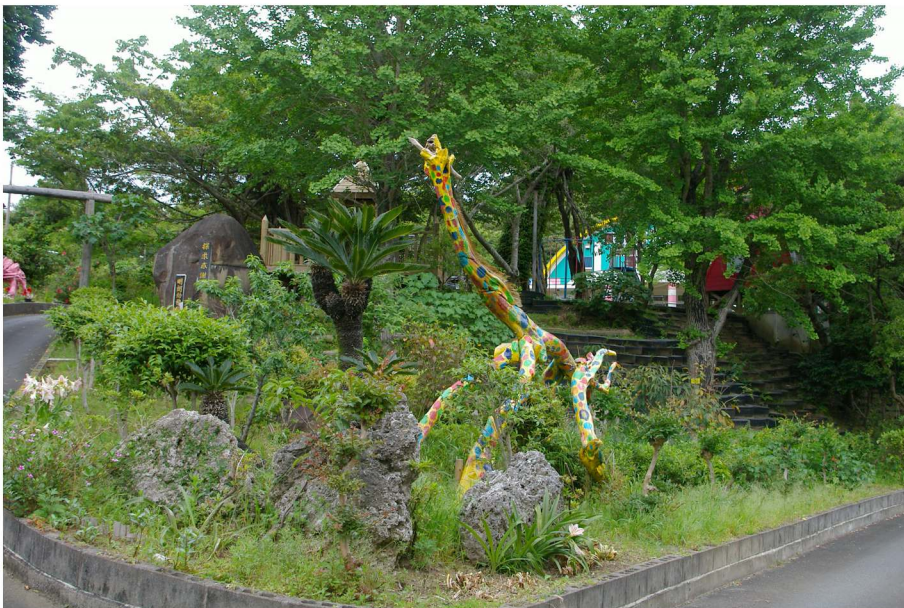
上記写真：2010年5月撮影、明朗幼稚園にて